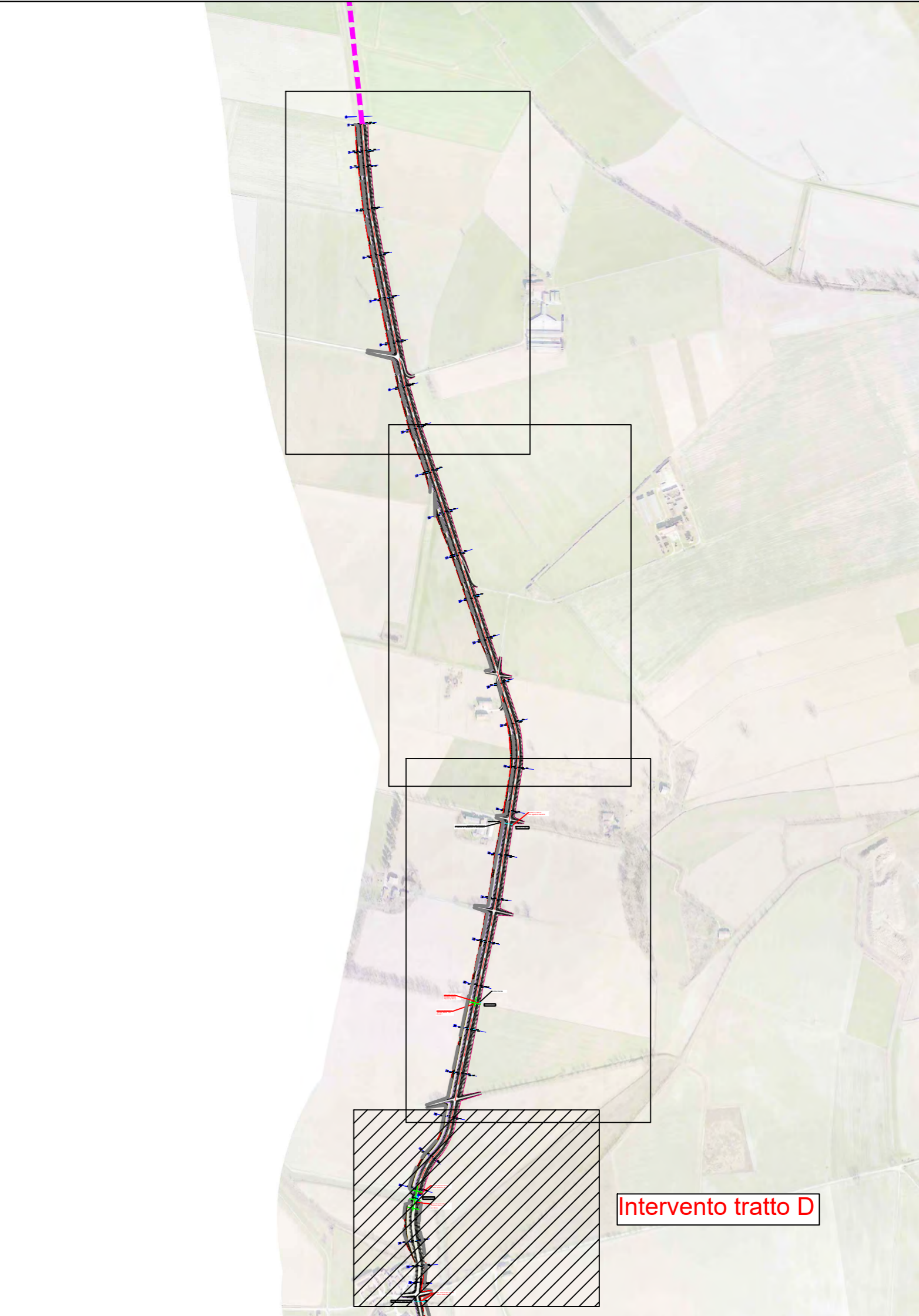
Inquadramento (scala 1:10'000)